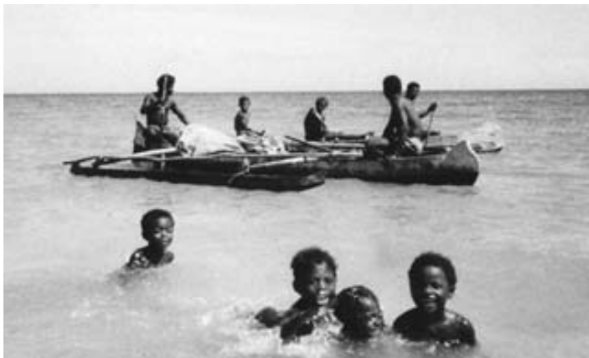
Foto Linn Johansen. Personene på bildet har ingen ting med innholdet i artikkelen å gjøre.

Hva slags turister kan tenke seg å komme til øya i det indiske hav? Er Madagaskar interessert i turister for en hver pris?