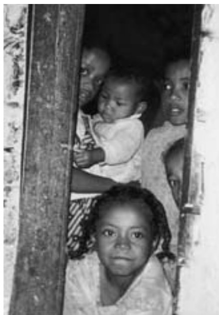
Mandroso - velkommen inn!

innen opplæring fra FIFAMANOR, hvilket betyr at de også har økt innflytelse på hvilke temaer som det skal veiledes videre innen enn kvinner. Derfor er det viktig at kvinner deltar både i den praktiske og teoretiske opplæringen - både for å tilegne seg ny kunnskap, og for at de skal være med på å definere temaer for videre opplæring!