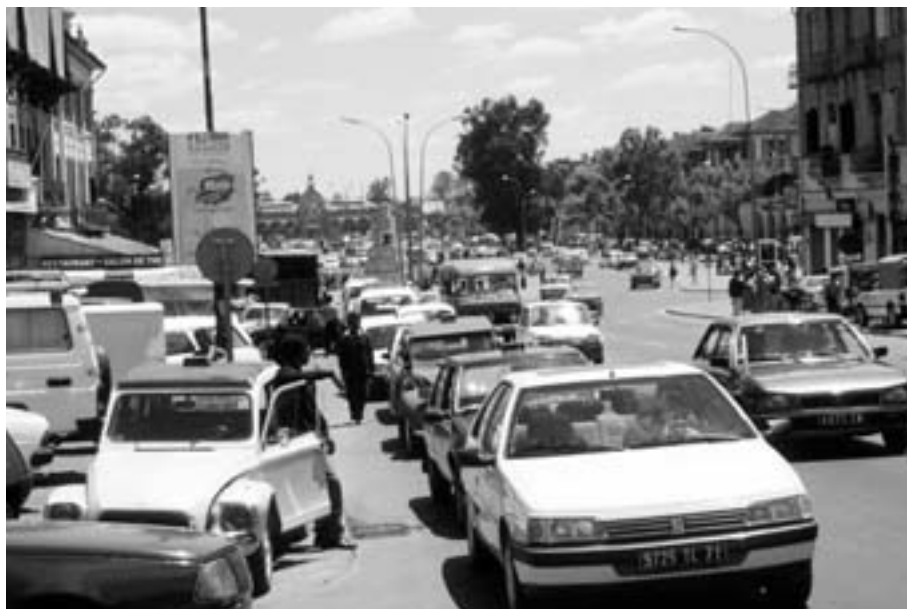
Infrastrukturen må utbedres.

Slik lyder innledningen om Madagaskar i Stortingsproposisjon nr. 1 (2002- 2003), som er statsbudsjettet for 2004. Dersom Stortinget går inn for regjeringens forslag, vil altså Madagaskar få tilbake sin plass på listen over “andre samarbeidsland”. Enkelte journalister har hevdet at Madagaskar skulle bli norsk “hovedsamarbeidsland”, men det har ikke vært på tale i denne omgang. Norge har sju “hovedsamarbeidsland”: Malawi, Mosambik, Tanzania, Uganda, Zambia, Bangladesh og Nepal. Med de nye samarbeidslandene: Madagaskar, Kenya og Afghanistan og de tidligere: Angola, Eritrea, Etiopia, Mali, Nigeria, Sør Afrika, Guatemala, Nicaragua, Indonesia, Kina, Pakistan, Sri Lanka, Vietnam, Øst-Timor og Det palestinske området, får Norge 18 land i kategorien “andre samarbeidsland”.