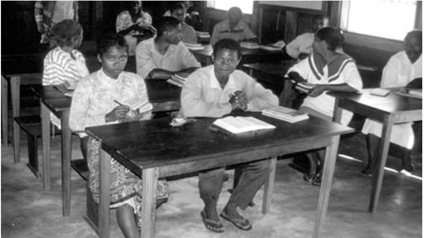
Utdanning er et viktig satsningsområde for den nye regjeringen.

Bistanden har resultert i at flere tusen elever og småbønder har fått undervisning og veiledning i landbruksteknikk og teori. Produksjon av poteter, ris og hvete har økt i sentrale områder i høylandet. Det samme gjelder melkeproduksjon som følge av krysning med norske NRF-kuer. Det har vært gitt støtte til bondeorganisasjoner og lagt vekt på å bedre situasjonen til kvinnene i bondesamfunnet. Norge har også støttet skolevirksomhet gjennom Den gassiske lutherske kirken (FLM) og UNICEF ved å inngå skolekontrakter. Elever, lærere, foreldre og lokale myndigheter forplikter seg til oppfølging av skolene som deltar i programmet, og som et resultat har antall elever som består eksamen økt. Teknikkene og opplæringsmetoden for arbeidsintensiv veibygging og rehabilitering av skolebygg, som Norge støtter gjennom ILO, ønsker nå myndighetene å ta i bruk i det nasjonale vedlikeholdsprogrammet for veiene.