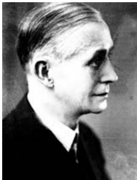
Fartein Valen

gen kan skape grunnlag for samarbeid og faglig nettverksbygging med gassiske kunstnere på flere kunstfelt og styrke lokal kompetanseutvikling i forhold til produksjon og formidling av scenekunst på Madagaskar. Samarbeidet vil samtidig bringe viktige impulser til norske kunstnere og publikum.