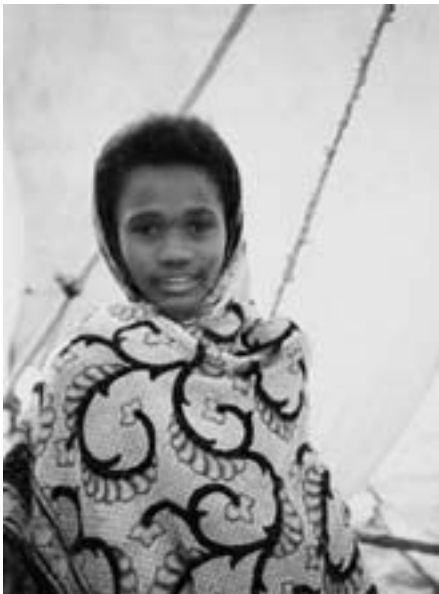
Foto Linn Johansen. Personen på bildet har ingen ting med innholdet i artikkelen å gjøre.

En stadig økende mengde turister har også gitt seg utslag i dårligere oppslutning rundt skolen. Det er heller ikke lett å argumentere med langsiktig lønnsomhet ved å lære å lese og skrive, når det gjennomsnittelige lønnsnivået for en person med høyere