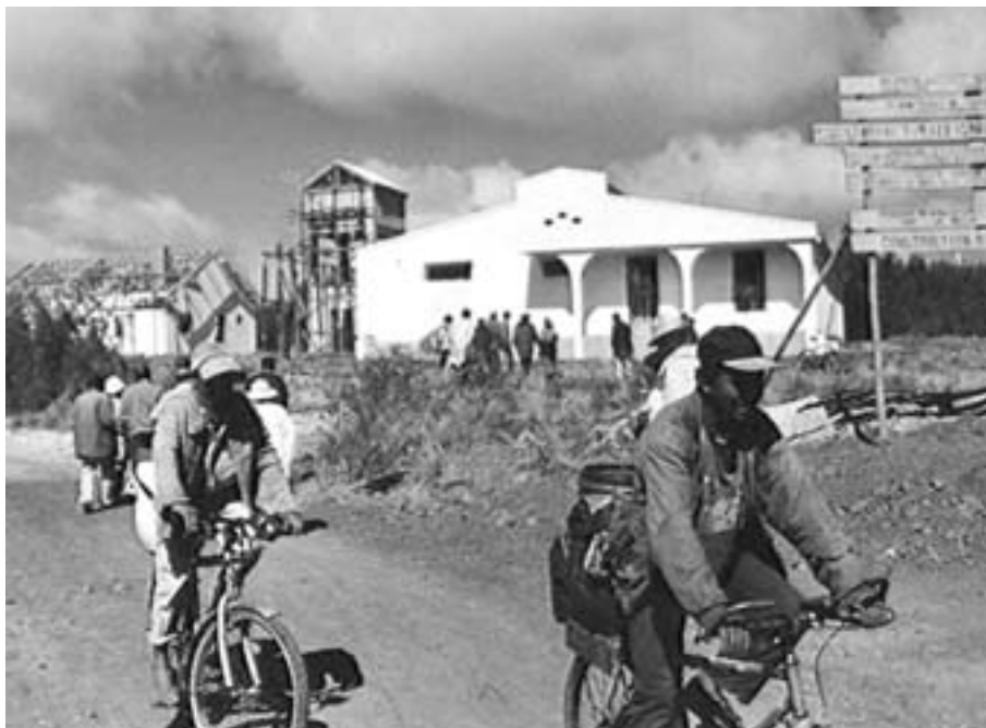
Melketransport på landsbygda utenfor Antsirabe

Mot slutten av 90-tallet ga NORAD 1.6 millioner NOK over 18 måneder til pilotfasen av et CARE-prosjekt som gikk på styrking av de sosiale forholdene for kvinner i Vakinankaratra-området. I 2000 ble det inkorporert i det nye NORAD-finansierte FIFAMANOR-prosjektet og la grunnlaget for det kvinneverretta arbeidet i FIFAMANORs veiledningstjeneste. I 20 år ble FIFAMANOR drevet som et prosjekt, men har etter hvert utviklet seg til å bli en institusjon med høy nasjonal status. FIFAMANOR er bygd opp rundt to forsøksstasjoner, Armor for mjølke-