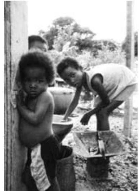
Personene på bildet har ingen ting med innholdet i artikkelen å gjøre.

Følelsen av å stå ansikt til ansikt med det jeg mistenkte sterkt for å være en middelaldrende pedofil turist, var for å si det mildt, meget blandet. Han passet ikke helt inn i min idé om den stereotype, fete, solkremglinsende middelaldrende mannen. Var denne mannen, som jeg gjenkjente fra markedet dagen før, og som tilsynelatende var en helt normal og til og med kjekk europeisk