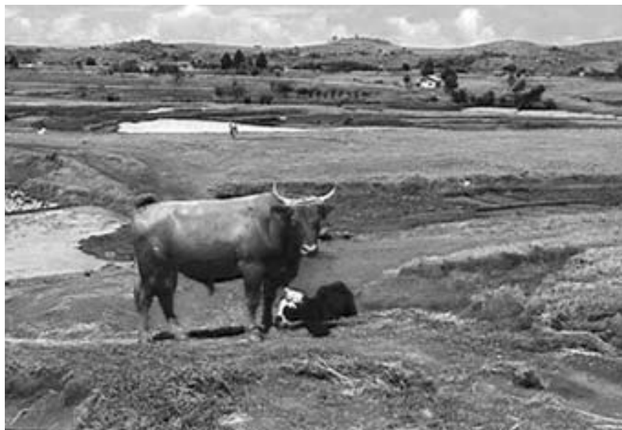
Forbedring av veiforholdene vil øke omsetningsmulighetene for bøndene

lertid betydd mye for matvaresikkerheten, også utenfor det egentlige prosjektområdet. I første omgang bidro både hvete, poteter og mjølk til å diversifisere matproduksjonen og gjorde folk mindre avhengige av ris alene som basisgrøde i kostholdet. Siden har tørrlandsris, søtpoteter, taro, og til en viss grad grønnsaker, (som en del av kvinneprosjektet,) ytterligere bidradd til et bedret matvaregrunnlag. Den utvidede produksjonen av energirike næringsmidler har gjort at det nå er mindre sjanser for direkte sult blant folk. Mjølkeproduksjonen gir dessuten betydelig økning i hjemmeforbruk av mjølk og mjølkeprodukter i prosjektområdene. De nye produksjonene har også stor be-