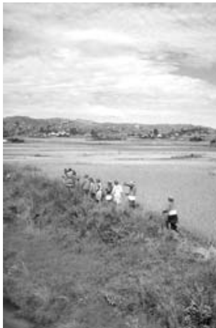
Mye av arbeidet på landsbygda bygger på dugnadsånd

Potetproduksjonen har også utviklet seg voldsomt og er av stor økonomisk betydning for bøndene i Vakinankaratra. Utviklingen er kommet dit at det nå er snakk om prøveeksport til øyene i Stillehavet, til Mauritius og La Réunion. FIFAMANOR er ledende institusjon på forskning og utprøving på poteter og har også ansvaret for andre knollvekster. Hvetedyrkinga har det imidlertid gått tilbake med. I begynnelsen ble hveten kjøpt opp av FIFAMANORs veiledningstjeneste, men etter hvert som produksjonen økte, kunne ikke dette fortsette. Ma-