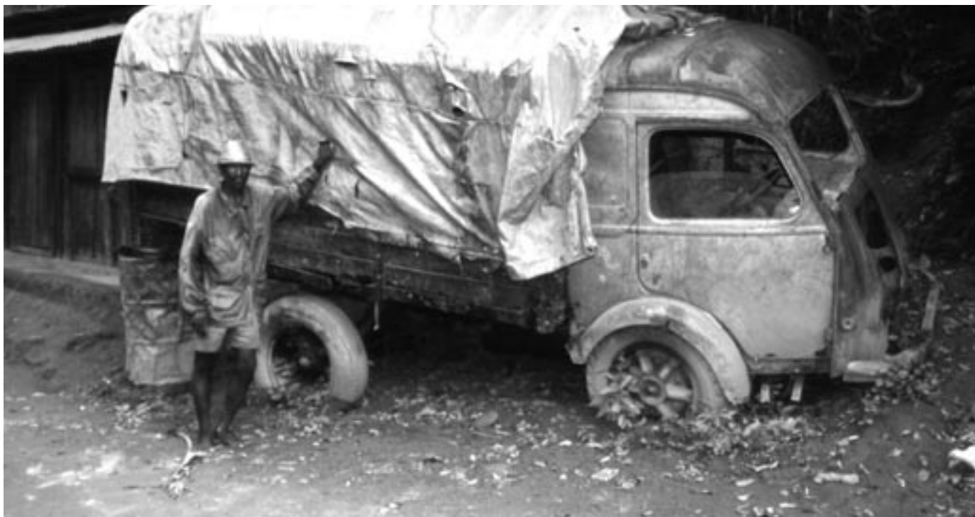
-"Nylig godkjent på 'visite technique'?"

vognkort før det ble overrakt veipolitiet for kontroll; det stanset alle spørsmål og åpnet alle sperrer. Men nå? Den gang ei.