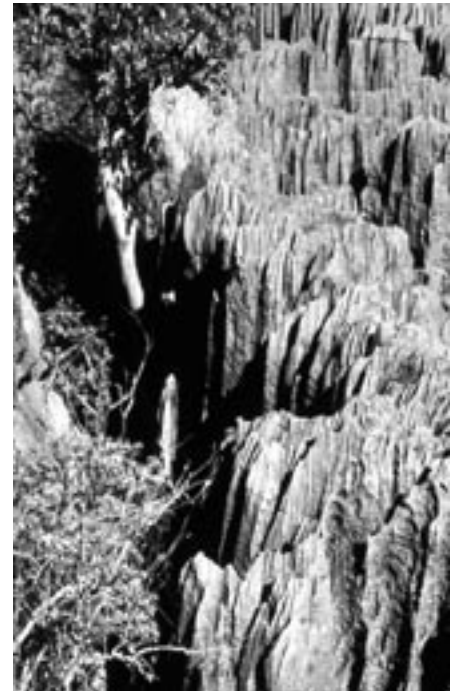
Fjellformasjonene i Tsingyområdet er kjent for sine spisse topper.

Like på nordsiden av Manambolo-elva ligger det som gjerne kalles lille-Tsingy med det karakteristiske piggete fjellet innenfor et relativt lite område. Stedt er godt tilrettelagt for turis-