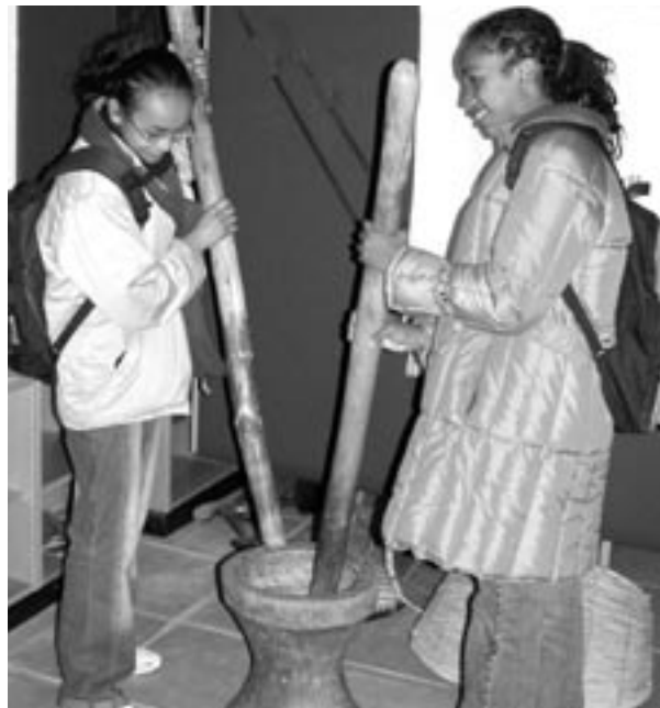
To av elevene i gruppen fra Lycee Andre Resampa, Antsirabe på besøk i Stavanger, oktober 2004. Her prøver de rismorteren i Misjonsmuseet på Misjonshøgskolen.